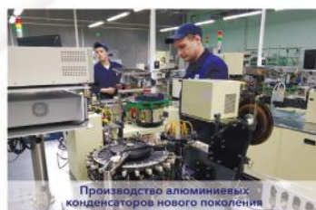
Производство алюминиевых конденсаторов нового поколения