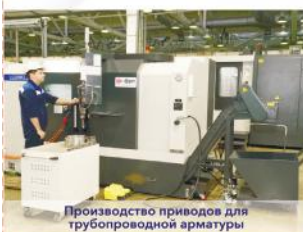
Производство приводов для трубопроводной арматуры

Городу присвоен статус Территории опережающего социально-экономического развития. Благодаря чему привлечено 16 инвесторов, инвестиции в новые предприятия - более 22 млрд. рублей, будет создано более 2000 новых рабочих мест. Проекты в стадии реализации. В 2020 году количество инвесторов увеличится еще как минимум на 6, это дополнительно более 400 млн. инвестиций и 400 новых рабочих мест.