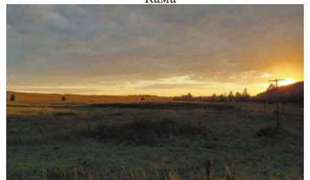
Между двух миров