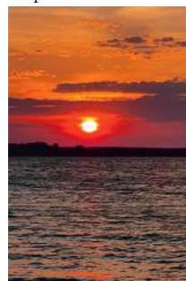
Рассвет родникового края