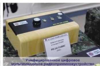
Унифицированное цифровое мультимедийное радиоприемное устройство