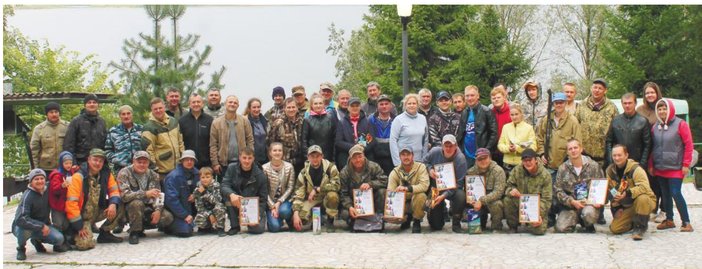
Организаторы и участники соревнований по летней ловле рыбы, берег реки Камы