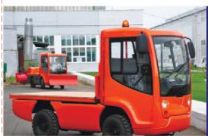
Унифицированная машина технологического электротранспорта