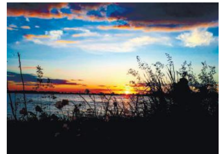
Один закат не похож на другой, краски неба не бывают одинаковыми!