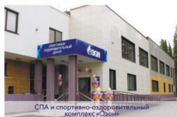
СПА и спортивно-оздоровительный комплекс «Озон»